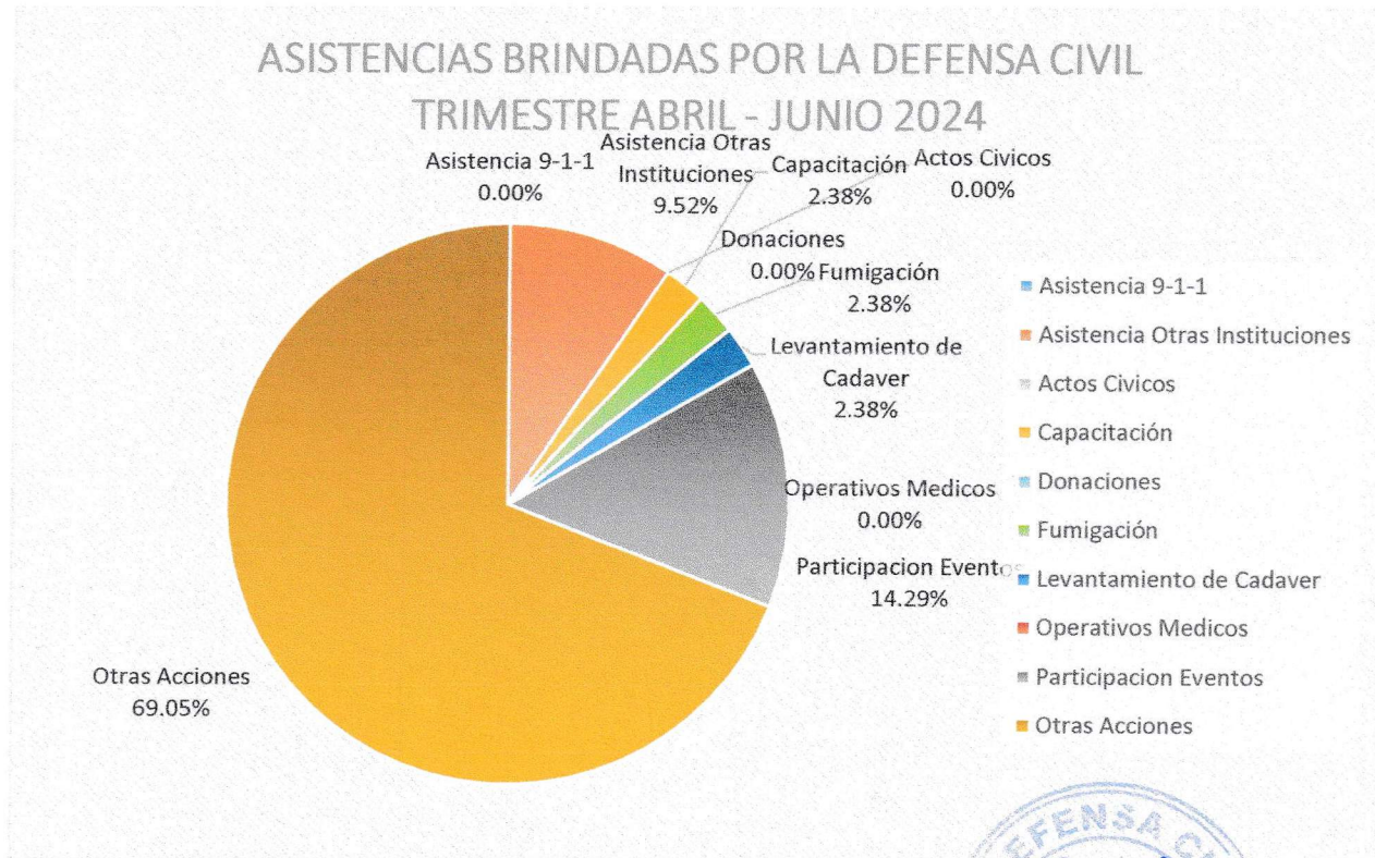
Ilustración 2. Acciones brindadas por la Defensa Civil Segundo trimestre 2024