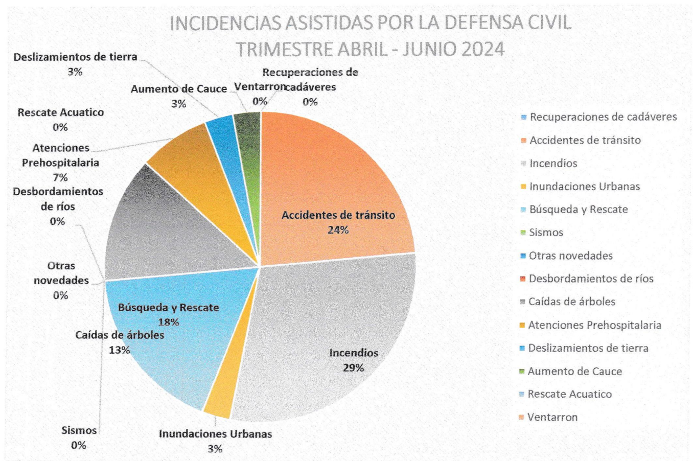
Ilustración 1. Incidencias asistidas por Defensa Civil Segundo Trimestre 2024

En este periodo, la Defensa Civil brindó asistencia a un total de SETECIENTO SETENTA Y CINCO (775) incidencias y acciones, cubiertas por miembros de la Defensa Civil. Las mismas se desglosarán en los gráficos a continuación.